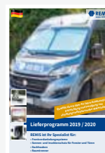
Zubehör Freizeit- fahrzeuge