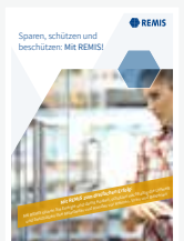
Benefits by REMIS