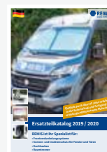
Ersatzteile Fahrzeug- zubehör